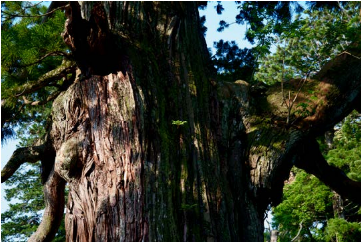
玉若酢命神社の大杉